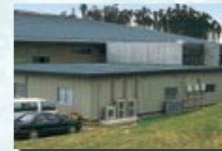
P-11 20. 事務所