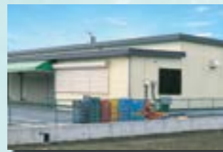
P-12 24. 店舗