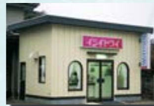
P-12 25. 店舗