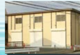
P-14 30. 倉庫