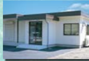
P-7 8. 事務所兼倉庫