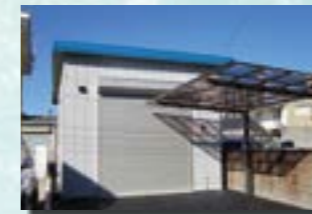
P-11 21. 倉庫