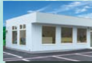
P-8 14. 店舗