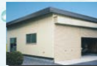
P-12 26. 車庫