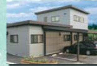
P-8 12. 事務所兼倉庫