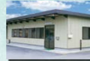
P-8 11. 事務所兼倉庫