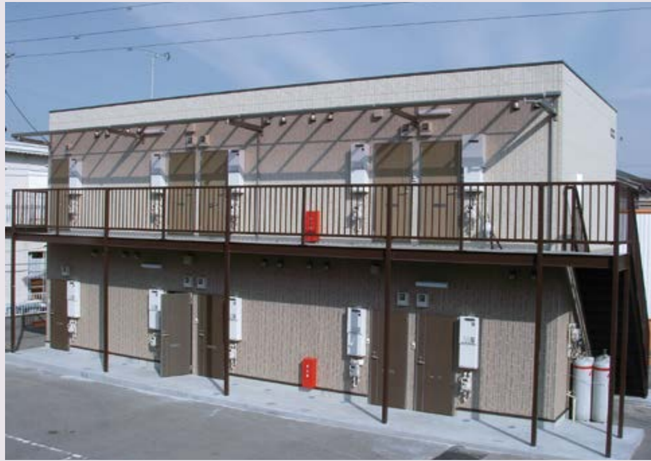
1. アパート (入口側)