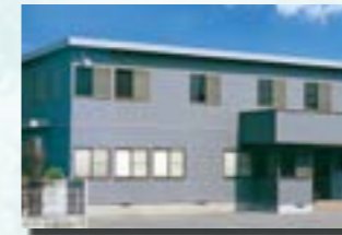
P-9 16. 事務所