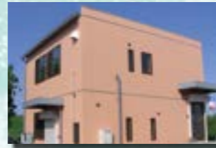
P-4 2. 事務所