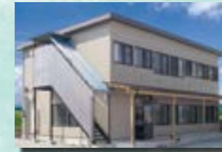
P-5 5. 宿舍