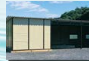
P-14 31. 作業場