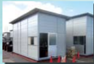
P-13 27. 機械室