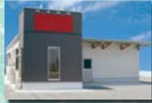
P-6 7. 事務所兼倉庫