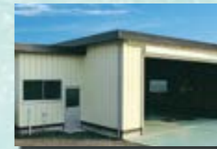
P-11 22. 整備工場