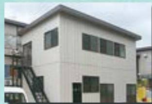
P-10 17. 休憩所兼倉庫