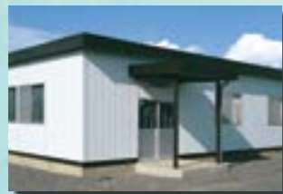
P-12 23. 事務所