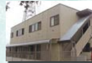
P-5 4. 宿舍