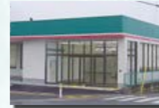
P-7 10. 店舗