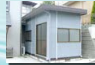
P-14 32. 休憩所

事務所 / 店舗 / 工場 / 倉庫 / アパート 確かな技術力と優れた機動力で実現した 超低価格プレハブハウス