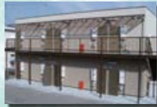
P-3 1. アパート