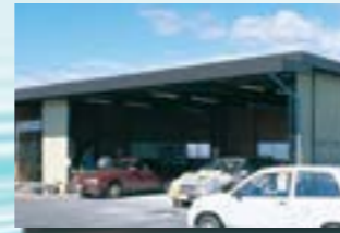
P-14 29. 整備工場