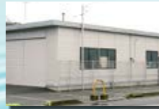
P-13 28. 工場