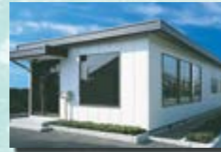
P-9 15. 事務所