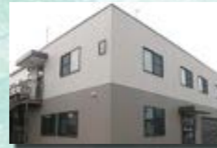
P-4 3. 事務所兼倉庫