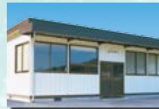
P-11 19. 事務所