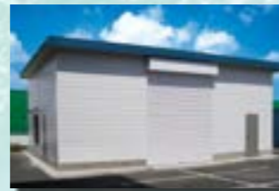
P-10 18. 倉庫