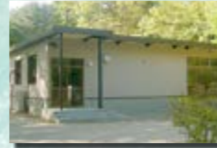
P-7 9. 事務所兼倉庫