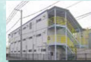
P-6 6. 事務所